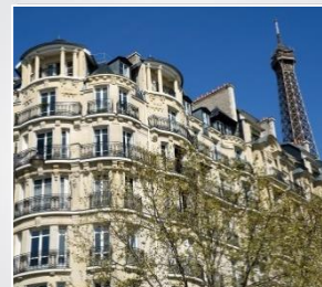
Investir dans l'immobilier