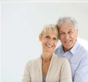
Épargne Retraite Loi Madelin