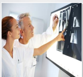
Bris de machine