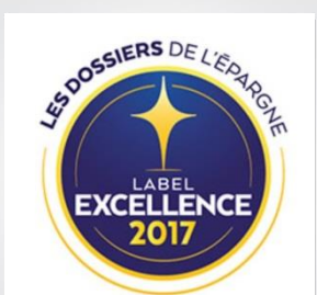
Prévoyance Loi Madelin