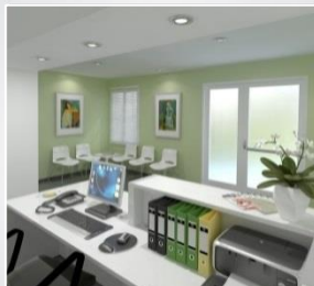
Assurance du cabinet – Perte d'exploitation