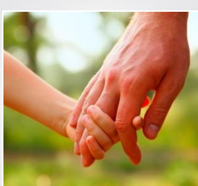
Garantie des Accidents de la vie – Obsèques -Dépendance