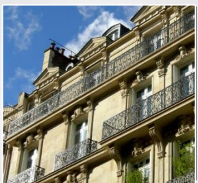
SCPI Foncières immobilières