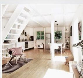
Assurance habitation Propriétaire non occupant Garantie de loyers