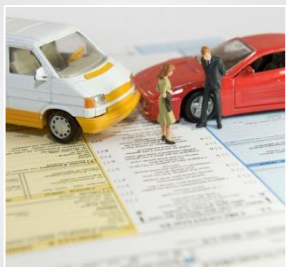
Assurance Auto- Moto